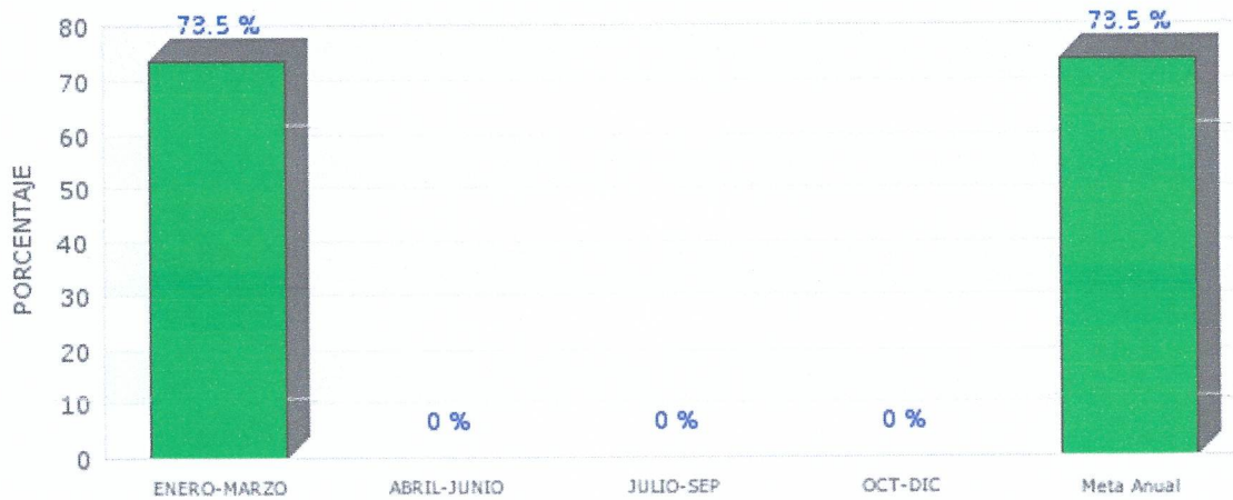
Gráfica de Indicador DE SERVICIOS OTORGADOS A PERSONAS CON MAYORES DESVENTAJA