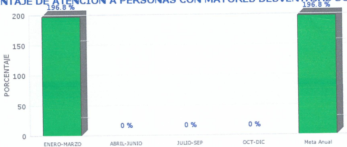
Gráfica de Indicador PORCENTAJE DE ATENCION A PERSONAS CON MAYORES DESVENTAJAS SOCIALES